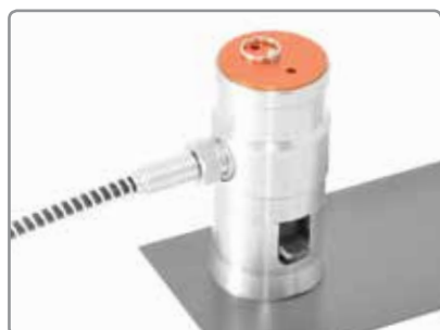
Le mécanisme peu encombrant permet d'accéder dans des endroits confinés. Le harnais de sécurité permet d'éviter des dommages accidentels lors de contrôles sur des surfaces verticales

Manuel, ergonomique et entièrement portable - idéal pour les contrôles d'adhérence sur site