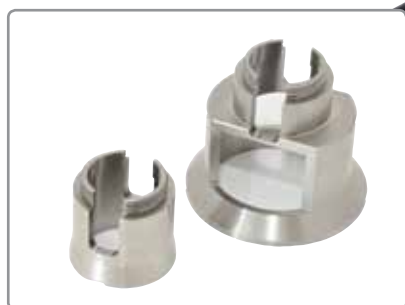
Diverses collerettes pour tester une grande variété de revêtements d'épaisseur et de pouvoir adhésif différents

Raccord rapide pour plots de diamètres 14,2; 20 et 50 mm