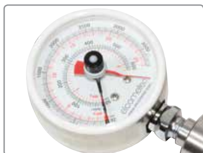
Jauges digitales ou analogues pour environnements difficiles ou dangereux

ASTM D4541, ASTM D7234, AS/NZS 1580.408.5, BS 1881-207, DIN 1048-2, EN 12636, EN 13144, EN 1542, EN 24624, ISO 16276-1, ISO 4624, JIS K 5600-5-7, NF T30-606, NF T30-062